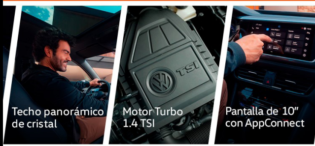
Techo panorámico de cristal